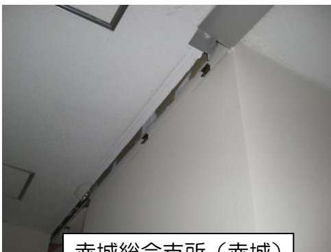
赤城総合支所（赤城） 天井の剥離