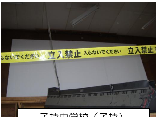
子持中学校（子持） 体育館ステージ照明の落下