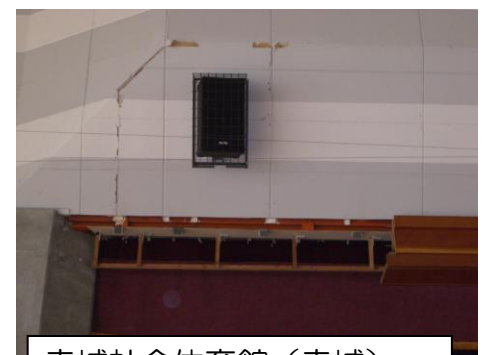
赤城社会体育館（赤城） 天井部の一部落下ひび割れ