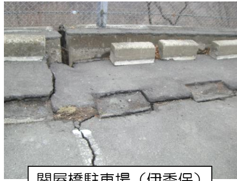
関屋橋駐車場（伊香保） 路盤沈下・ひび割れ