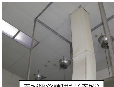
赤城給食調理場（赤城） ダスト・換気口の剥離