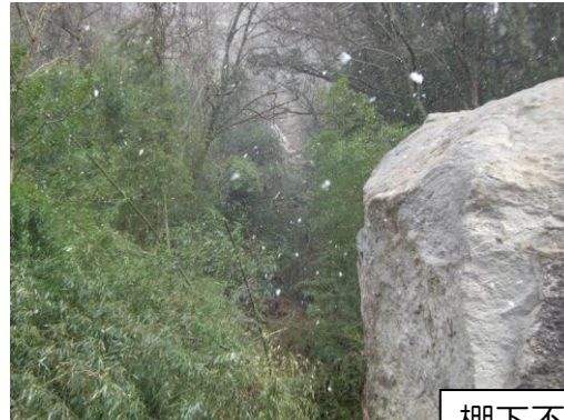
棚下不動尊（赤城） 落石