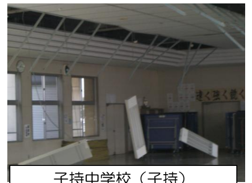
子持中学校（子持） 食堂の天井破損・照明の落下