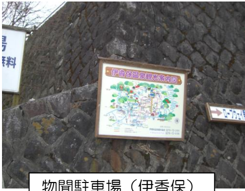
物間駐車場（伊香保） 石垣のひび割れ