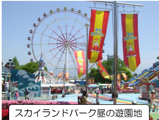
スカイランドパーク昼の遊園地

渋川スカイランドパーク遊園地の指定管理期間が平成26年3月31日に終了することから、指定管理者の公募を行った結果、1法人から応募があり、渋川スカイランドパーク遊園地指定管理者候補者選考委員会において、候補者を選考した結果、引き続き、渋川市公共施設管理公社を選定しました。指定期間は平成26年4月1日から平成31年3月31日までです。