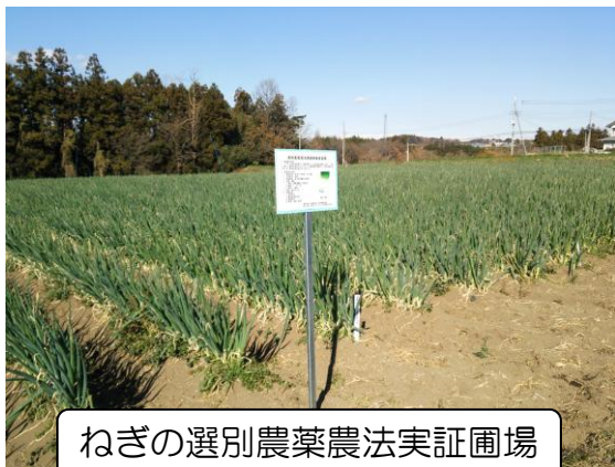
ねぎの選別農薬農法実証圃場