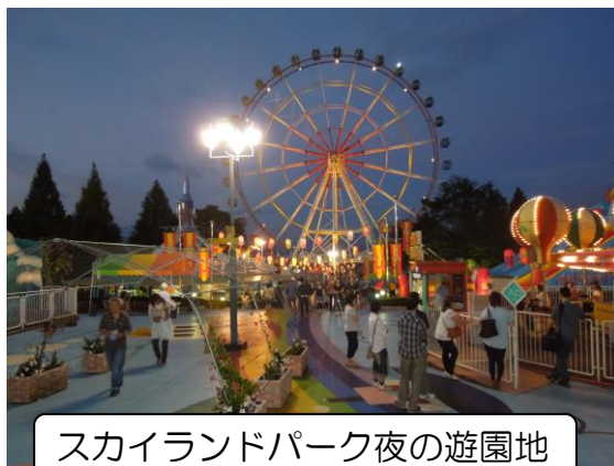
スカイランドパーク夜の遊園地