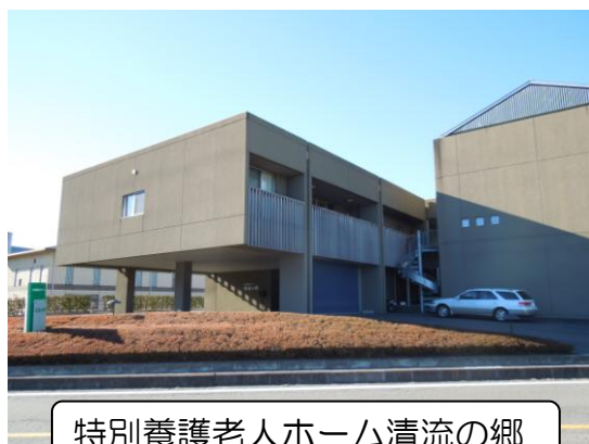
特別養護老人ホーム清流の郷

清流の郷は指定管理者に永光会を指定し、平成20年4月1日から管理していただいていたが、公募による売却を進めた結果、3法人から申請がありました。審査の結果、永光会に決定しました。売却金額は2億8500万円ですが、借入金残高は2億9987万円、財産処分納付金は7853万円となり、9340万円の持出しです。