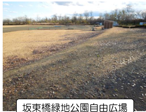
坂東橋緑地公園自由広場