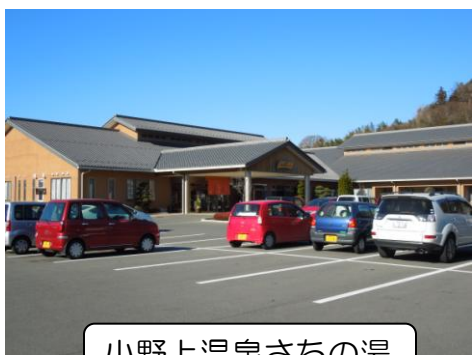
小野上温泉さちの湯

指定管理期間は平成25年4月1日から平成30年3月31日までの5年間です。指定管理料の設定はありません。