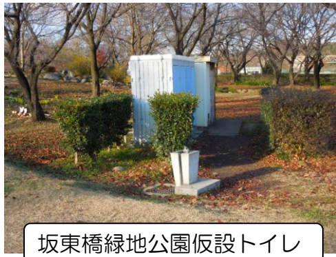
坂東橋緑地公園仮設トイレ

坂東橋緑地公園自由広場の利用者から、トイレの水が出にくいので、新設のトイレを設置してほしいと要望がされていました。当該場所は、河川敷のため固定タイプは設置できないが、仮設トイレではなく、FRP構造の移動式簡易水洗トイレを設置すると説明がされました。工期は今年度中で場所については、北側の現在仮設トイレが設置してある場所になります。