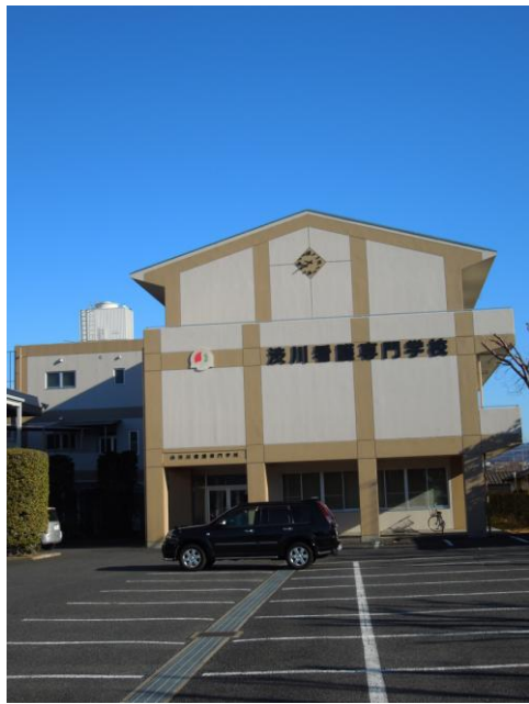
渋川看護専門学校

類似する他の制度との併用は可能であり、対象は各校1名を学校推薦により決定、本市については若干名を予定したいと説明がされました。金額については、月額2万円を予定していますが、制度の詳細は今後整備し、施行日は平成25年4月を予定しております。